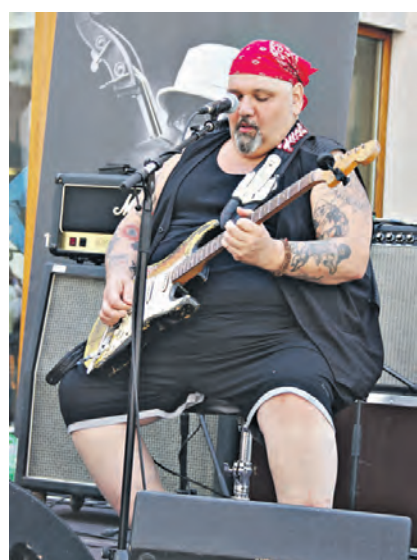
«Popa Chubby» sorgten vor dem Hauser für Stimmung.