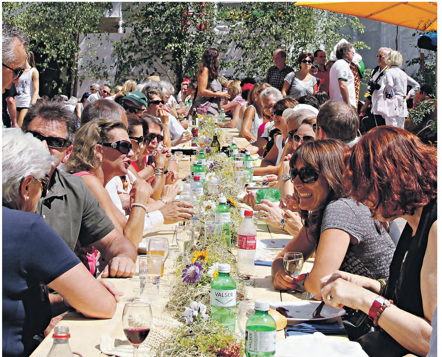
«Carol and the Fall» begeisterten am Samstag auf dem Crystal-Dach, am Sonntag stand in der Fussgängerzone das Gesellschaftliche im Vordergrund.