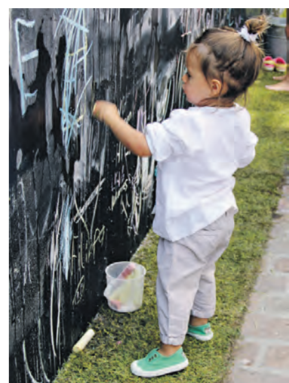
Der Versuch an der «Sprayerwand».